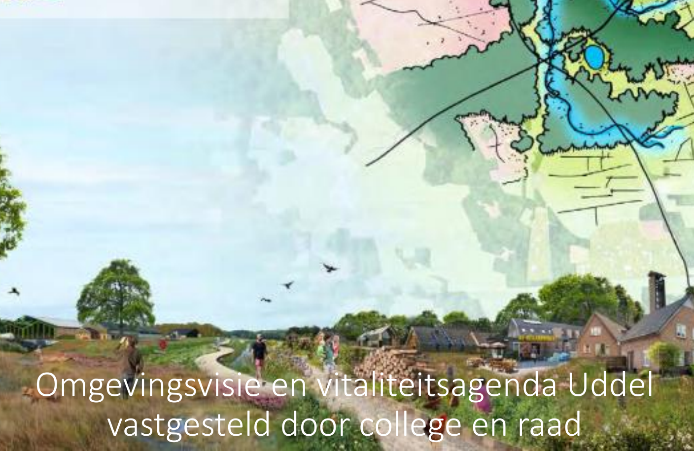
Omgevingsvisie en vitaliteitsagenda Uddel vastgesteld door college en raad

3. Uitbreiding bedrijventerrein noordoost Het reguliere bedrijventerrein van Uddel aan de noordoostzijde kan mogelijk nog verder vergroot worden. Hierdoor ontstaat uitplaatsingsruimte voor bedrijven die nu nog in het gevoelige beekdalenlandschap liggen. Ook nieuw te vestigen bedrijven kunnen hier wellicht een plek krijgen. Het is belangrijk voor Uddel om een goed economisch perspectief te behouden.